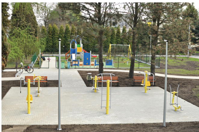
Siłownia plenerowa i plac zabaw