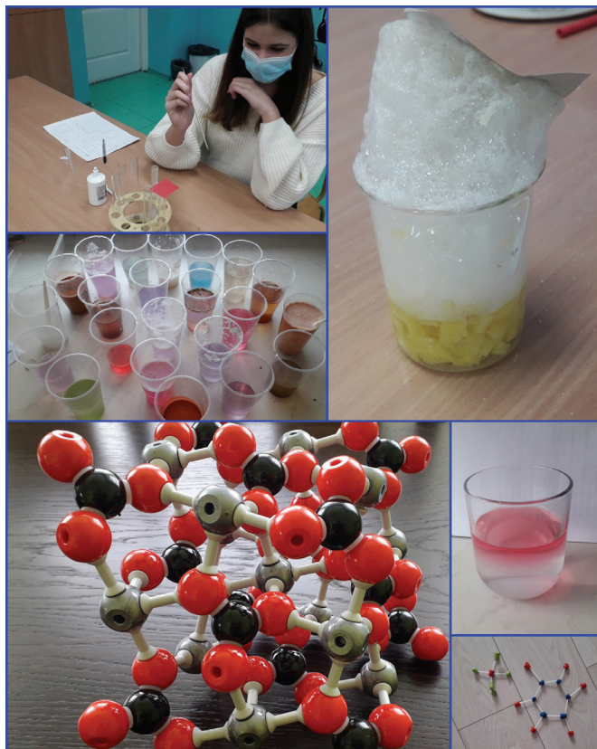
Program obejmuje m.in. eksperymenty chemiczne

Na fizyce nie mogło zabraknąć zajęć inspirowanych jednym z najsłynniejszych fizyków czyli Izaakiem Newtonem. Uczniowie budowali koło Newtona, na przykładzie kapsli sprawdzali jak działa kołyska Newtona. Natomiast podczas eksperymentu z siłą