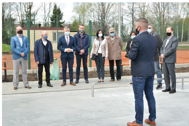
Przywitanie zaproszonych gości – otwarcie obiektu

Zwolennicy spokojniejszych rozrywek mogą poćwiczyć na dobrze już znanych naszym mieszkańcom urządzeniach z siłowni „pod chmurką”, zaprosić dzieci na bogato wyposażony plac zabaw, lub po prostu pospacerować. Kaniowskie tereny rekreacyjne są areną słynnego „Święta Karpia” czy „Rewii Orkiestr Dętych”, mieści się tam także kort tenisowy, górką do