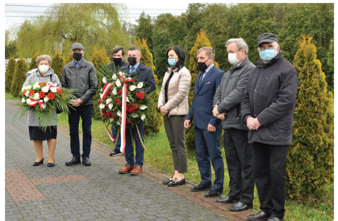
Uczestnicy spotkania w Janowicach