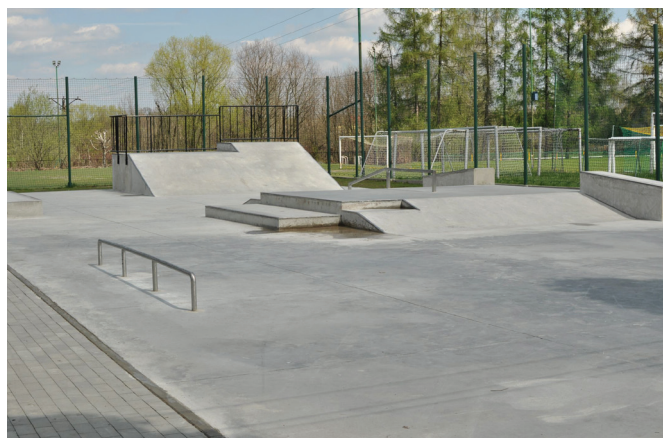
Skatepark na terenach rekreacyjnych