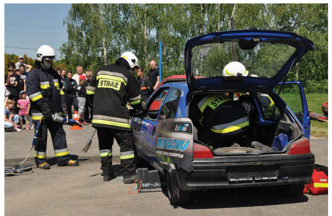
Pokaz ratownictwa technicznego