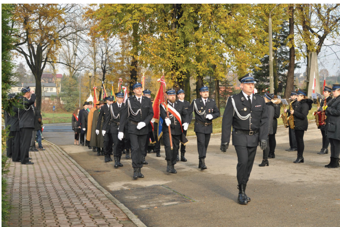
Pochód strażaków – uroczystości patriotyczne